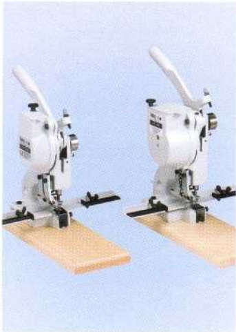
Abb. 101-00 / 101-04